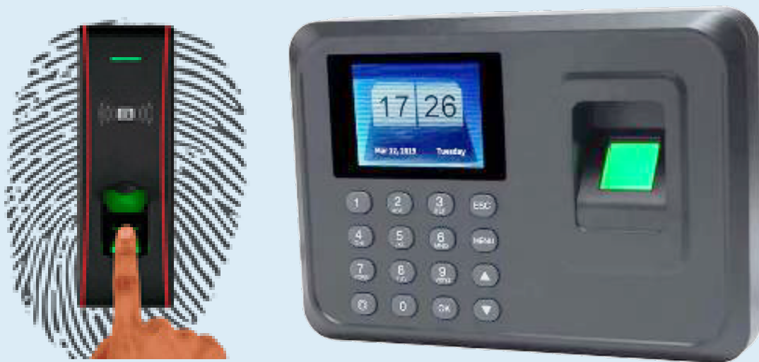
Dispositif de lecture d'empreinte digital

La Chambre de Commerce, d'Industrie, des Mines et de l'Artisanat (CCIMA) renoue avec la technologie biométrique. Après une période de mise en veille, le dispositif d'identification par empreinte digitale a été réactivé dans les locaux de l'institution. Objectif : renforcer la sécurité, fluidifier les procédures internes et moderniser les outils de gestion administrative.